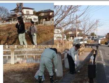
〈本社〉ゴミ拾い、カーブミラー拭き