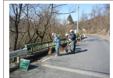
〈棚下〉道路清掃(落葉、堆積土除去)