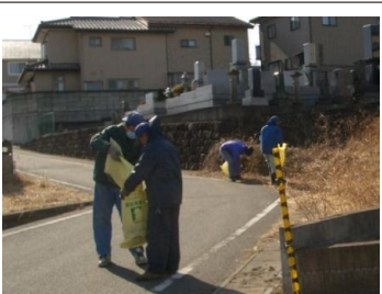
〈機材センター〉ゴミ拾い