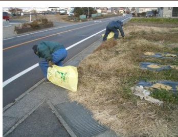
〈機材センター〉ゴミ拾い