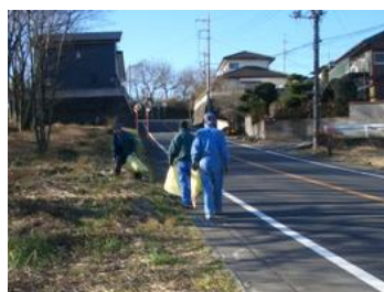
〈機材センター〉ゴミ拾い