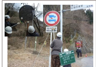
〈棚下〉道路清掃(標識、ミラー掃除)