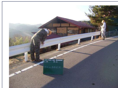
〈赤岩〉道路、ガードレール清掃