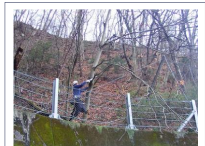
〈棚下〉道路支障木伐採