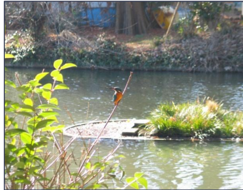
↑ A 地点で見られたカワセミ お茶の水・石橋から10m程先の水辺 後はアメンボ島