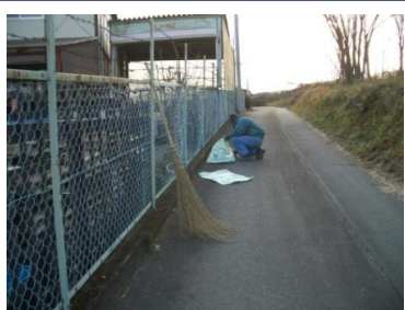
〈機材センター〉ゴミ拾い