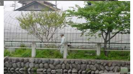
会社周辺道路、堤周辺のゴミ拾い、 除草など。 (渋川市八木原)