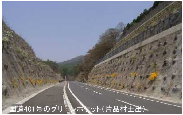
国道401号のグリーンポケット(片品村土出)