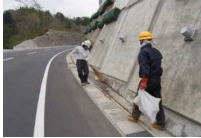
国道401号の施工場所周辺と駐車場の道路清掃、ゴミ拾い。 (利根郡片品村土出)