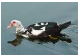
数ヶ月前から 八木原堤に棲んでいる バリケン(カモの仲間)

八木原堤のアメンボ島の メンテナンスを行った際に様々な生物が出てきました。 卵を抱くカルガモやザリガニ、オケラなど・・・