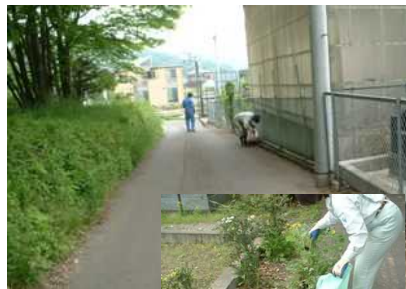
機材センター周辺道路のゴミ拾い、除草。 (渋川市有馬)