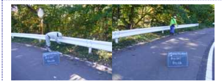
林道の草刈りをしました。〈高戸谷現場〉