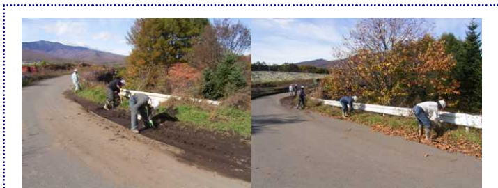
現場侵入道路の草刈り、道路清掃をしました。〈田代現場〉

他の各現場でも関係会社の方々に協力していただき、周辺道路などのゴミ拾い、草刈りなどを行いました。