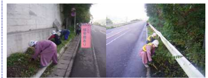
県道道路脇の草刈りをしました。〈水上現場〉