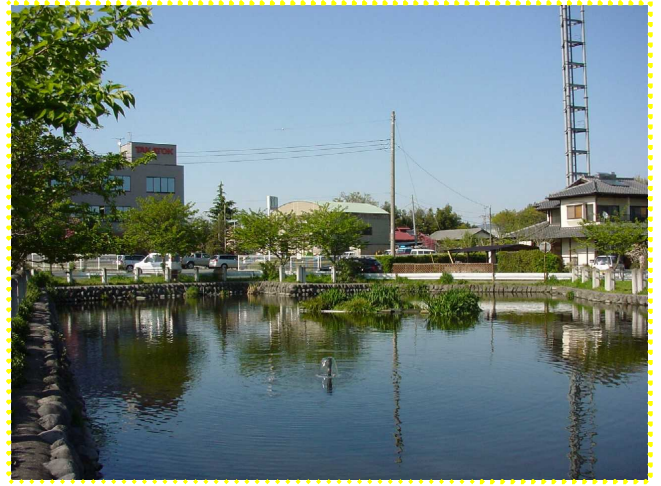
八木原堤のアメンボ島