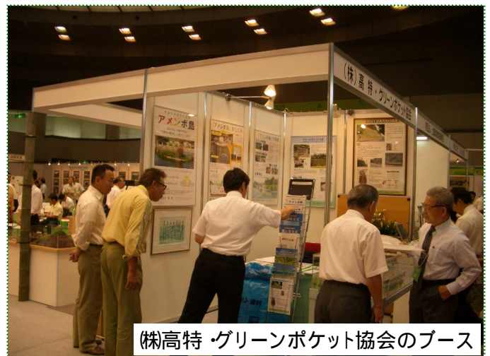
(株)高特・グリーンポケット協会のブース

高特・グリーンポケット協会のブースにも多数の方に来ていただき、興味を持っていただきました。ありがとうございました。