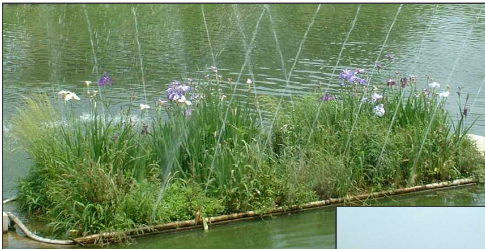
鶴生田川の写真の一番左のアメンボ島

鶴生田川のアメンボ島にはハナショウブの 原種のノハナショウブが植えられており、 シンプルな美しさです。(橋側の2台)