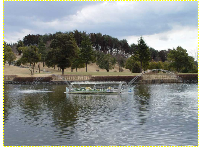
白水ゴルフ倶楽部のアメンボ島を 春バージョンに模様替えしました。

桜も散りはじめ、水も緩む季節となりました。 わが社の湖沼浄化事業の最近のニュースです。