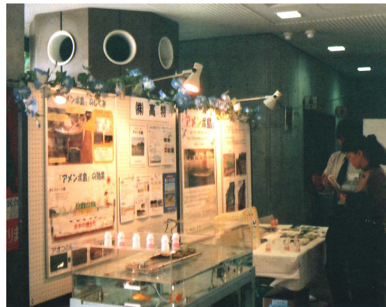
高特の展示コーナー (アメンボ島のミニチュア、パネルなど)

来月は「ぐんま新技術フェア」への出展を予定しております。詳細は、また後日お知らせします。